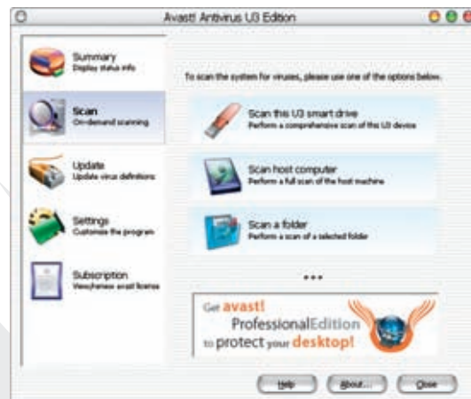
screenshot del programma avast! antivirus U3 (Scansione)